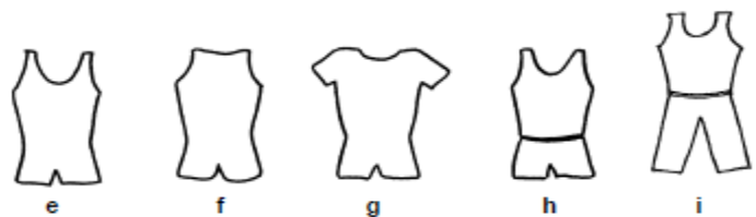
樣例 E 到 I 前後開口處相仿